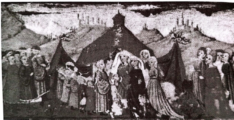
Chupat Tallit – an Italian painting from the 15 th century