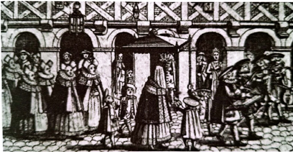
Bride under a canopy walking to her wedding in the Frankfurt ghetto, 1617

16. והמנהג פשוט עכשיו לקרות חופה מקום שמכניסים שם יריעה פרוסה על גבי כלונסות. ומכניסים תחתיה החתן והכלה צרצים ומקדשה שם ומצרכין שם צרכת ארוסין ונשואין. ואח"כ מוליכים אותם לבית ואוכלים ביחד במקום לנוע. וזהו החופה הנוהגת עכשיו.