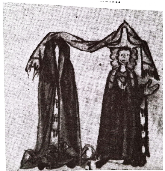
Illustration of groom (right) and bride (left) covering their heads with a tallit , in Machzor Worms 1272