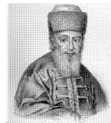
Rabbi Yechezkael Landau