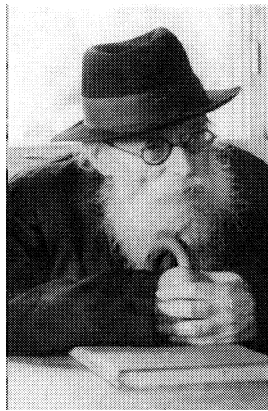
The Chazon Ish